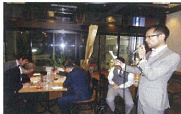
答え合わせは先生から