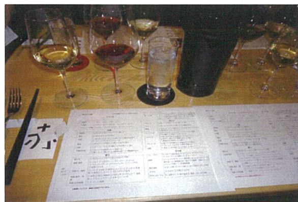
テイस्टングシート(ソムリエ試験同様の内容でした)