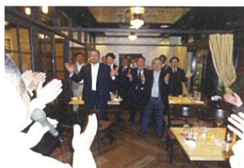
そして、最後は一丁締め