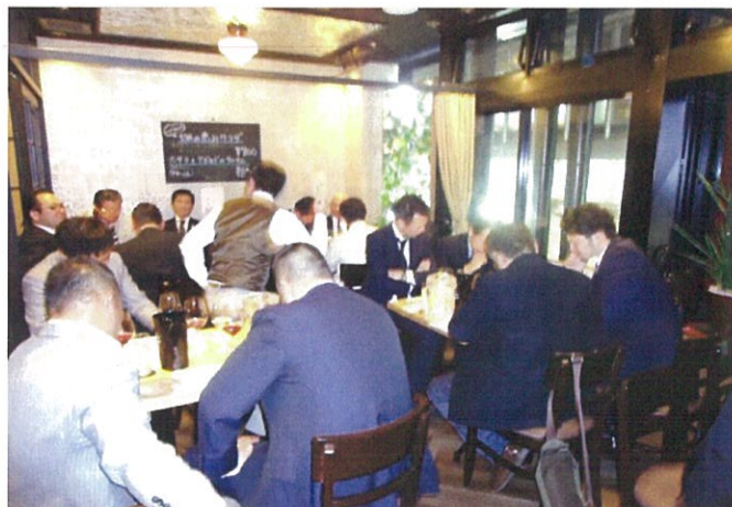
テイस्टングの難しさを体感する皆さん