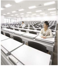
ノートパソコン対応教室