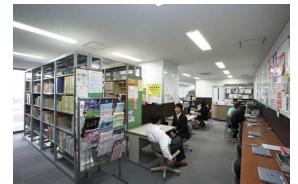
キャリアセンター