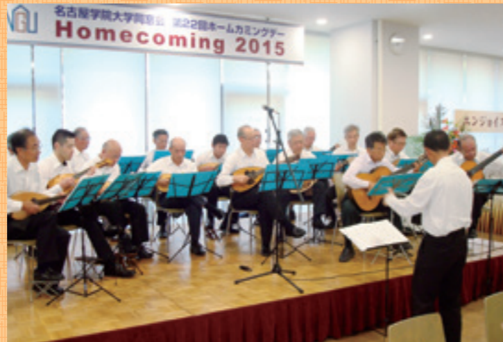
マンドリンクラブOBによる演奏