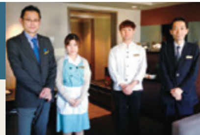
◆ 2016年秋季学期留学生別科在籍予定者内訳【総計34名】(男10名、女24名)

期 間: 春季/2017年 2月13日(月)~24日(金) ※土・日曜日を除く 実 習: 上記期間中の2週間(実働10日間) 実 習 時 間: 原則として午前9時から午後5時まで 待 遇: 「通勤費」「手当」「食費」について、原則として支給していただくことなく結構です。 使 用 言 語: 原則として日本語 保 険: インターンシップ実施期間中の事故(通勤および実習中)については、本学で学生教育研究災害傷害保険及び学研災付帯賠償責任保険に加入しています。 対 象: 留学生別科生 募 集 方 法: 本学国際センターが、受入企業・団体一覧を学生に開示。参加を希望する学生には、希望の実習先などを記入する「インターンシップ参加申込書」(本学所定様式)を提出させます。 学 生 の 選 考: 本学教職員が選考いたします。 誓 約 書: 実習期間に知り得た機密および個人情報の守秘義務を遵守するため、実習生は誓約書を提出いたします。 確 認 書: 企業・団体と本学との間で、インターンシップの実施に係る確認書を交換します。 インターンシップ受け入れの詳細は、名古屋学院大学 国際センターまでお問い合わせください。