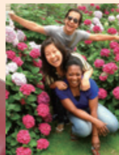
中国留学時のクラスメイトたちと一緒に(中国)