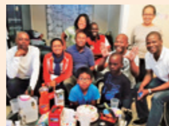
ほぼ毎週のように行われるホームパーティー(コンゴ)