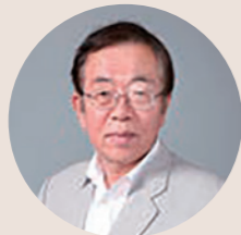
早川 厚一 教授 (1980年就任)