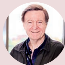
R.T.ダナヒュー 教授 (1977年就任)