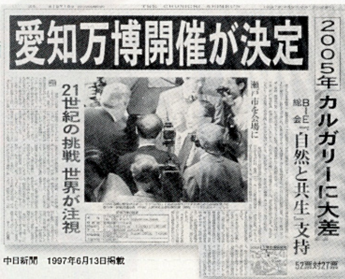
中日新聞 1997年6月13日掲載

間もなく迎える21世紀。その新たな時代最初の万国博覧会が、私達の母校、名古屋学院大学のある愛知県瀬戸市に決まりました。 今回の万博は、新しい地球創造…自然の報智というテーマをかかげ、21世紀に自然と人間がどう共生していくかを考えるものだと考えています。