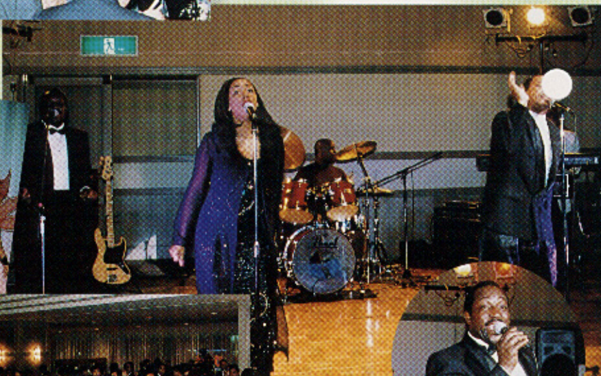
▲美声に聴き惚れた ジャスタイム