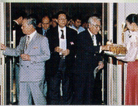
▲待ちに待った懇親会場へ入場