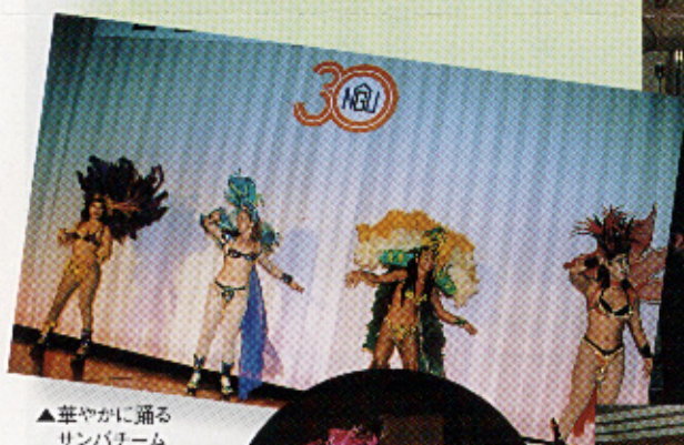
▲華やかに踊る サンパチーム