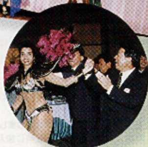
▲リズムにのってみんなでダンス