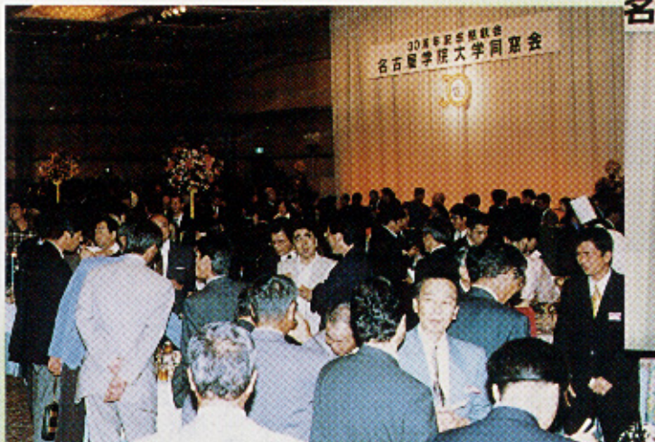
▲久しぶりの友と歓談を楽しむひととき