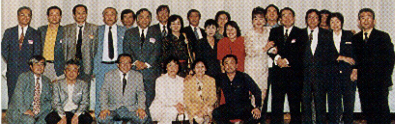
「E」の同窓生のみなさん