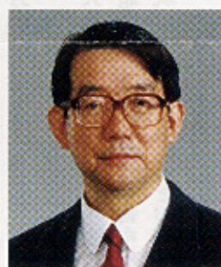
▲上智大学教授 渡部 昇一氏