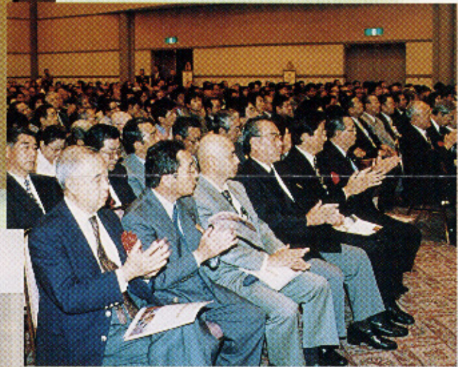
▲熱心に聴き入る同窓生・教職員・一般の方々