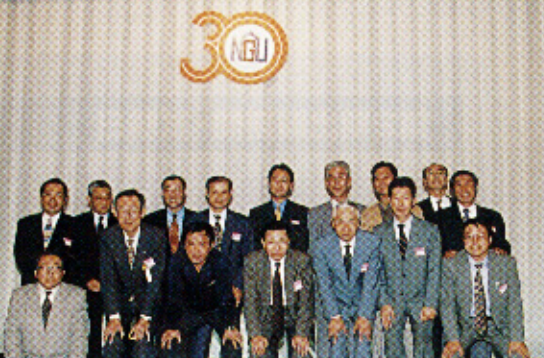
▲自動車部OBのみなさん